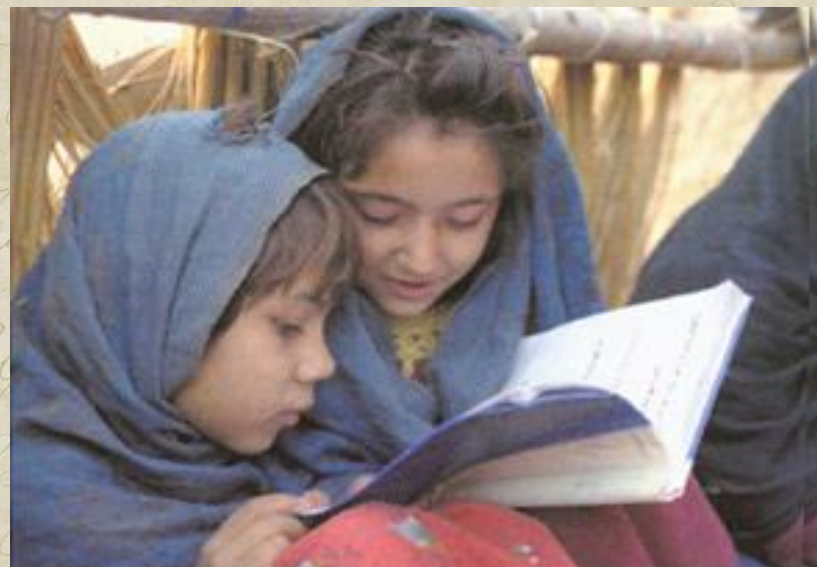
Две девочки читают учебник в организованном на открытом воздухе классе неформальной женской школы в г. Джелалабад в провинции Нангархар на востоке Афганистана.